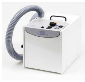
Staubabsaugung S-Serie vacuum cleaner S-Series

Filter, Staubbeutel und Ersatz Kohlebürsten